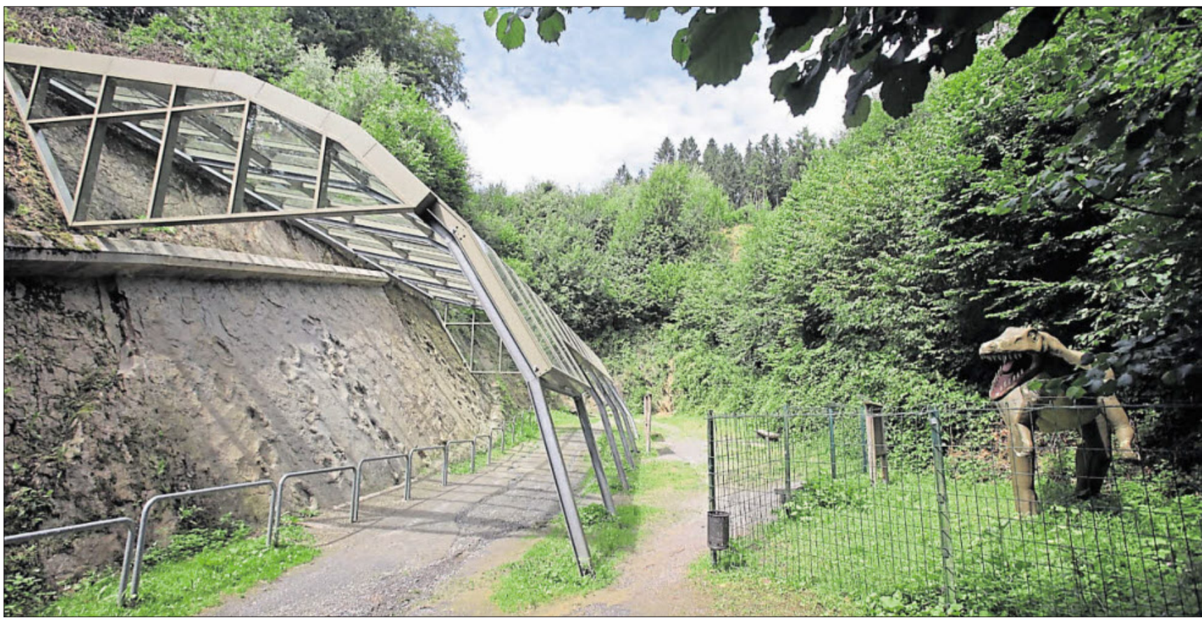
Viel Grün gehört zum Steinbruch, in dem sich die Barkhauser Saurierspuren befinden.

Landkreis Osnabrück: ☎ 0541/5011111, 9 bis 14 Uhr, für medizinische Fragen Land Niedersachsen: Impfhilfeline, ☎ 0800/9988665, 8 bis 20 Uhr, Fragen zur Impfung und Vergabe von Impfterminen für Über-80-Jährige